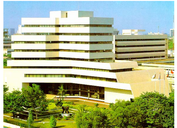
สำนักเลขาธิการอาเซียน

7. สำนักเลขาธิการอาเซียน (ASEAN Secretariat) เป็นหน่วยบริหารงานกลาง ของอาเซียน ตั้งอยู่ที่กรุงจาการ์ตา ประเทศ อินโดนีเซีย มีเลขาธิการอาเซียน ซึ่งได้รับการคัดเลือกจากประเทศสมาชิก ให้ดำรงตำแหน่งคราวละ 5 ปี เป็นหัวหน้าสำนักงาน และมีรองเลขาธิการอาเซียน 2 คน ดำรงตำแหน่งคราวละ 3 ปี