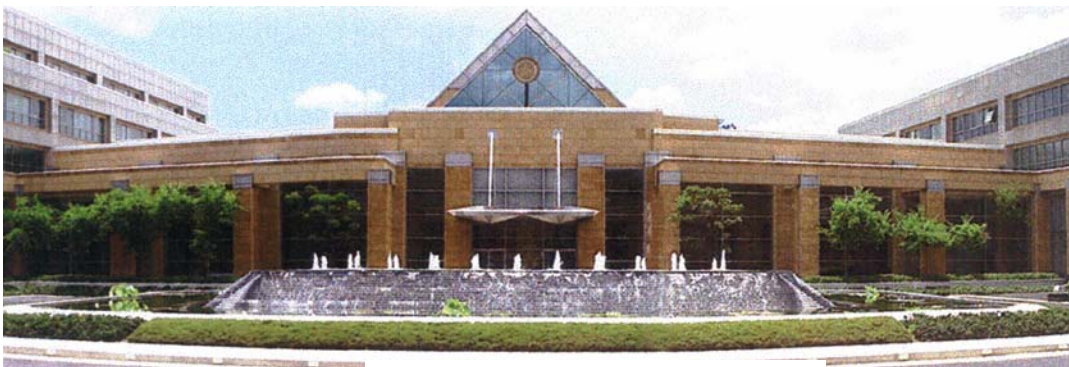
กระทรวงการต่างประเทศ

คือ กรมอาเซียนในกระทรวงการต่างประเทศแต่ละประเทศสมาชิก เพื่อประสานงานกับส่วนราชการต่างๆ ภายในประเทศ และกับประเทศสมาชิกอื่นในการดำเนินกิจกรรมต่างๆ