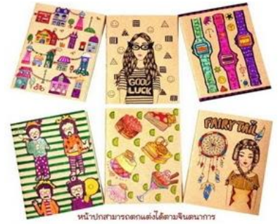
หน้าปกสามารถตกแต่งได้ตามจินตนาการ

ขอเชิญชวน นักเรียนที่มีจิตอาสา มาร่วมเป็นส่วนหนึ่งกับกิจกรรมทำสมุดทำมือ เพื่อนำไปบริจาคมอบให้กับน้องๆ ต่างจังหวัดที่ขาดแคลนสมุดและอุปกรณ์การเรียน นักเรียนสามารถเก็บชั่วโมงกิจกรรมเพื่อสังคมฯ ดังนี้